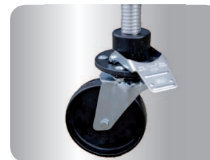
Doppelbremslenkrollen haben einen Durchmesser von 200 mm und sind unter voller Belastung leicht zu entriegeln und können 25 cm ausgespindelt werden