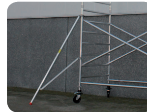
Dreiecksausleger stufenlos einstellbar