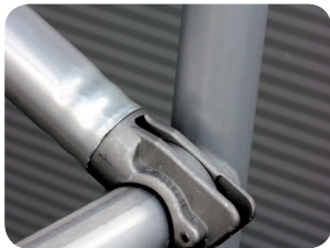
Gespresste Verbindung zwischen Klaue und Strebenrohr