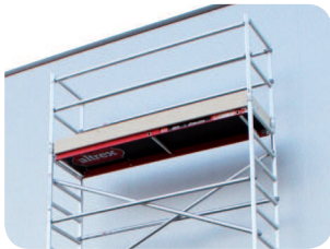
Bordbretter aus Holz mit Scharnieren zum platzsparendem Transport